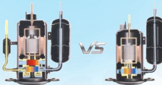
Gree kaheastmeline inverter kompressor